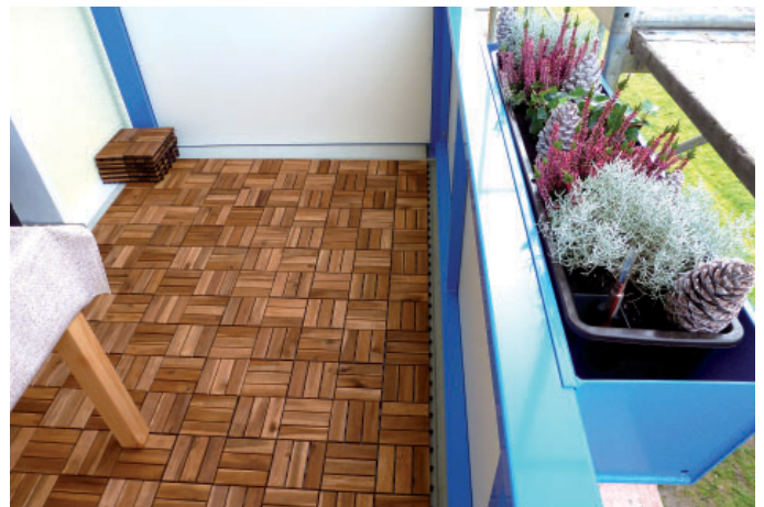
Familie Wachtelborn hat ihren Balkon gleichermaßen dekorativ und praktisch gestaltet.