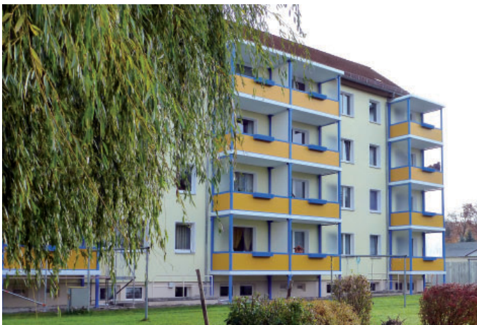
Die Mieter in der L.-Frank-Straße haben ihre Balkone bereits rege genutzt.