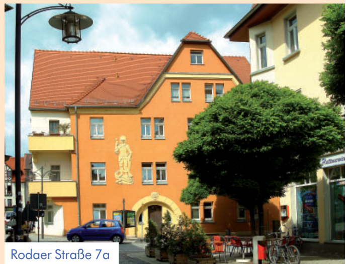
Rodaer Straße 7a

Interessenten können sich an unsere Mitarbeiterin Frau Wolfram wenden, Telefon (03 64 81) 597-0. Sie beantwortet Ihnen im persönlichen Gespräch sachkundig alle Ihre Fragen!