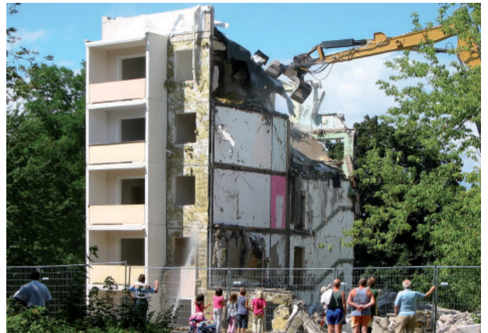
Im Jahre 2008 erfolgte der Rückbau des Wohnblockes Thomas-Müntzer-Straße 61–65 mit 50 Wohnungen in Neustadt-Süd.