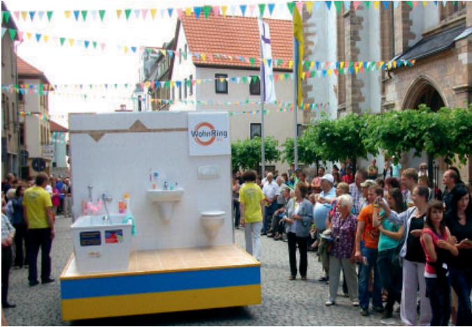
Der Festwagen der WohnRing AG zum Stadtjubiläum.