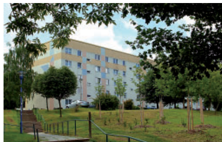
Wohnumfeldgestaltung in Neustadt-Süd.