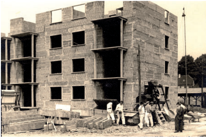
Bau von AWG-Wohnungen Anfang der 60er Jahre.