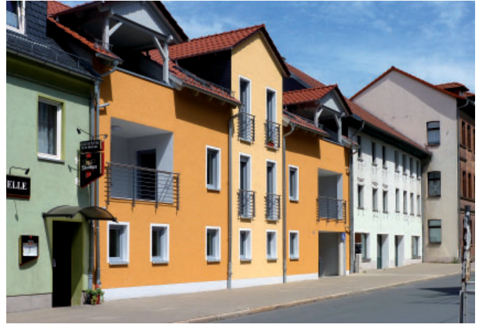
2014 fertiggestellt: Ernst-Thälmann-Straße 26.

► Im Sommer wird das Neubauvorhaben Ernst-Thälmann-Straße 26 begonnen. Große Schwierigkeit beim Abbruch des Ursprungshauses mit Baustop. Weiterführung und Beginn des Rohbaus erst im Spätherbst und somit Bauverzug.