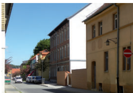
Blick in die August-Bebel-Straße.