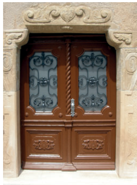
Markt 13/14: Die historische Eingangstür nach der Sanierung.

Nach Abschluss der Baumaßnahmen kann das denkmalgeschützte Geschäftshaus Markt 13/14 zur Nutzung übergeben werden. Dafür wurden 1,1 Mio. Euro investiert. Mitte des Jahres ziehen die Mitarbeiter der WohnRing AG in das Gebäude um.