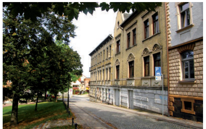
Am Friedensgarten 1