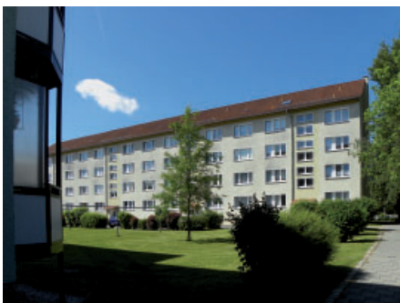
Blick in die Leonhard-Frank-Straße.